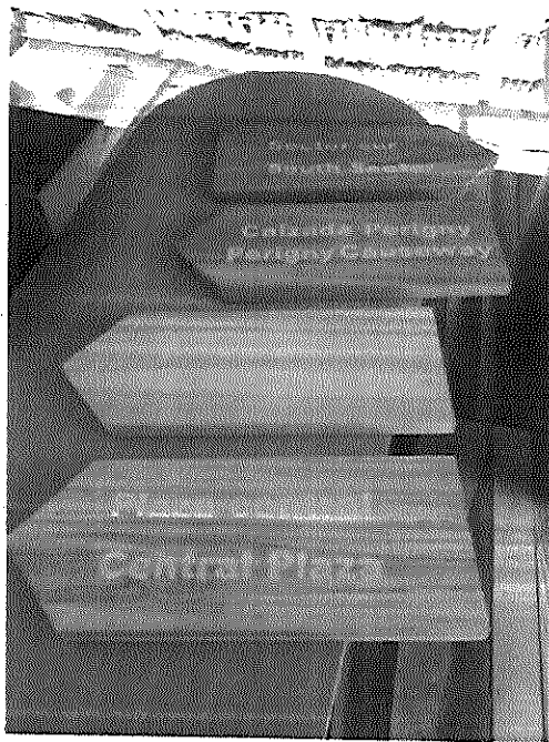
Fig.10: Rótulos direccionales de Nakum.

Se realizaron rótulos direccionales indicando los sectores principales del sitio arqueológico Nakum: sector norte, sector sur, calzada Perigny, plaza central y uno en el cruce entre el campamento y el sitio arqueológico. Estos rótulos son básicos para la comprensión del conjunto urbanístico del sitio.