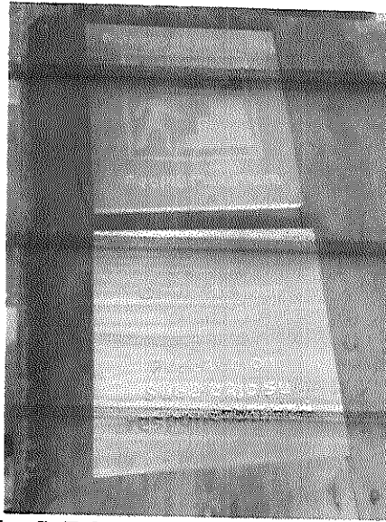
Fig. 4 y 5: Rótulos normativos templo 216.

“no nadar” y de capacidad de carga y advertencia de riesgo. Se busca que los visitantes respeten la normativa establecida por su propia seguridad.