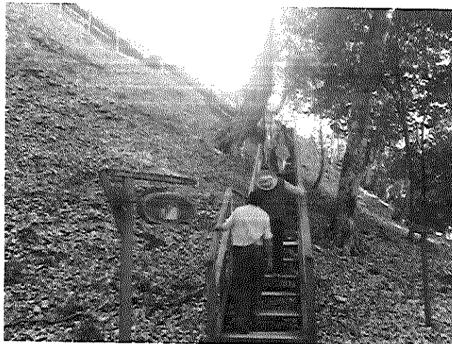
Fig.9: Atención a periodista de revista nacional en recorrido por el sitio arqueológico Yaxha.

Se atendió a una periodista de una revista nacional. La revista dedicará un artículo al PNYNN y a la organización de prestadores de servicio de las comunidades aledañas al parque. La revista brindará este espacio con el fin de atraer la visita de sus lectores y resaltar la importancia y contribución de las áreas protegidas a la sociedad.